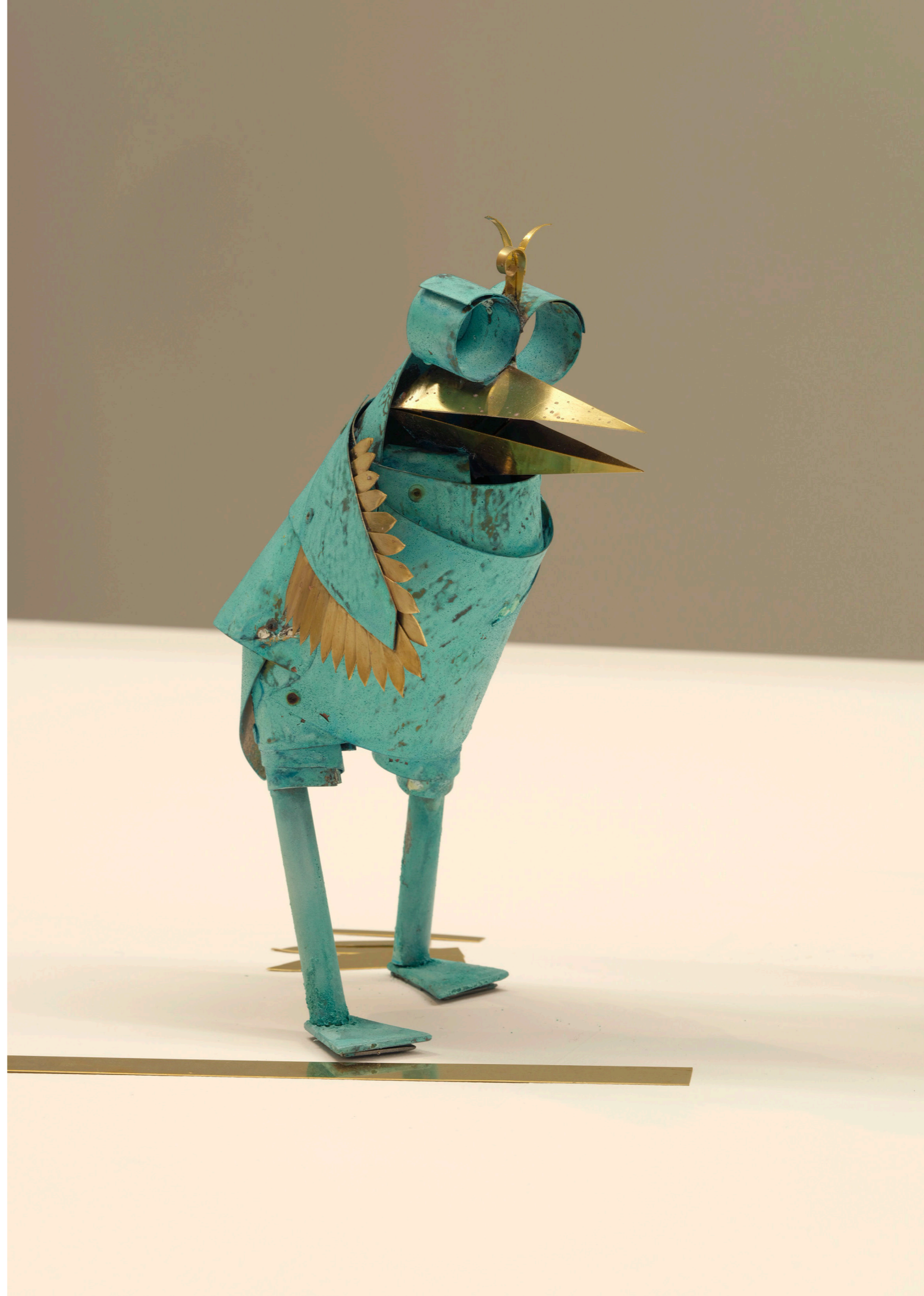
CAME/S 9444, Caroline Mesquita Moineau vert (petit), 2024 patinated brass / ottone patinato 31 × 20 × 22 cm (12 ¼ × 7 ⅞ × 8 ⅝ inches) NOT AVAILABLE