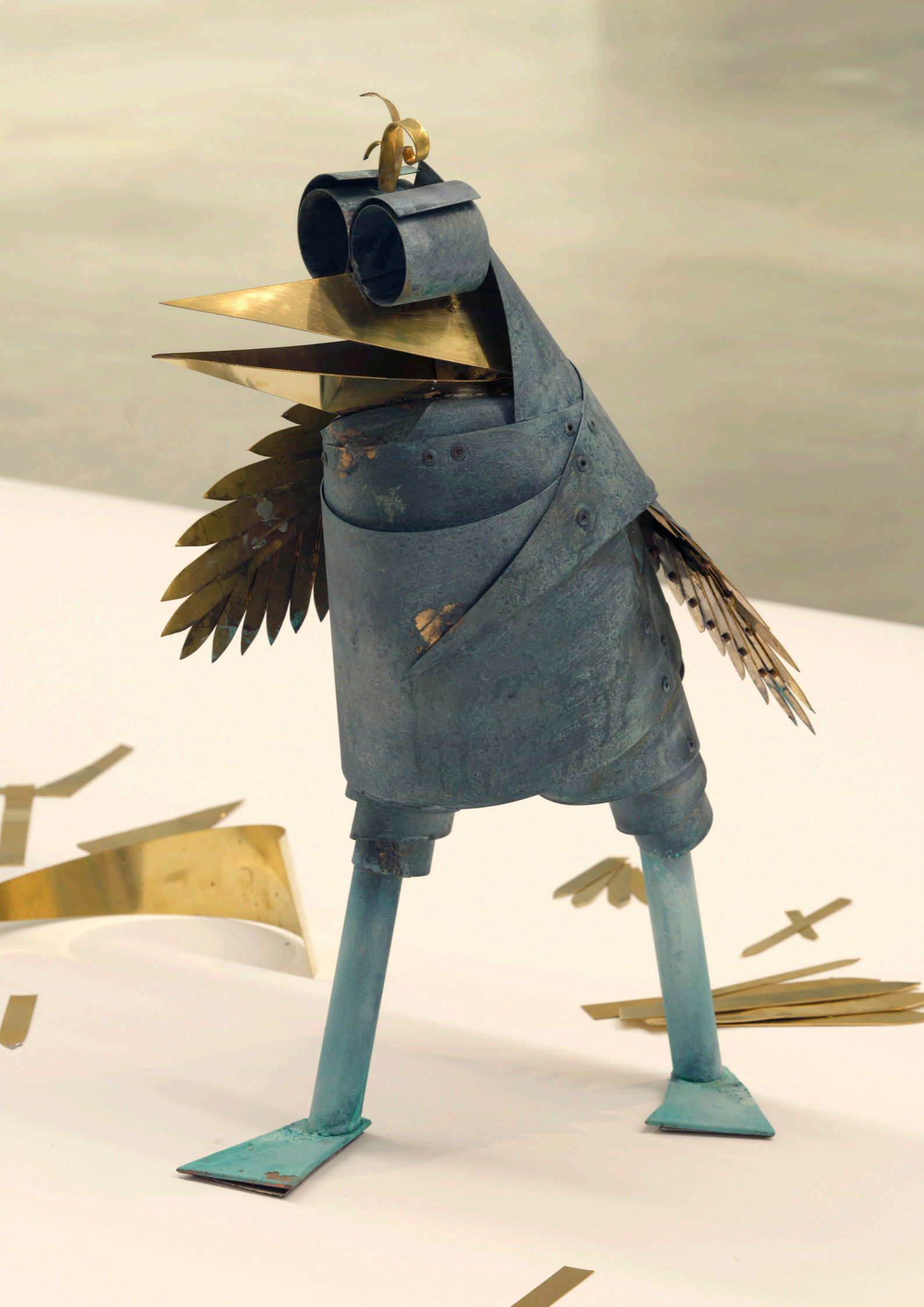
CAME/S 9443, Caroline Mesquita Moineau bleu (moyen), 2024 patinated brass / ottone patinato 45 × 30 × 30 cm (17 ¾ × 11 ¾ × 11 ¾ inches) 6000.00 € (22% VAT excluded)