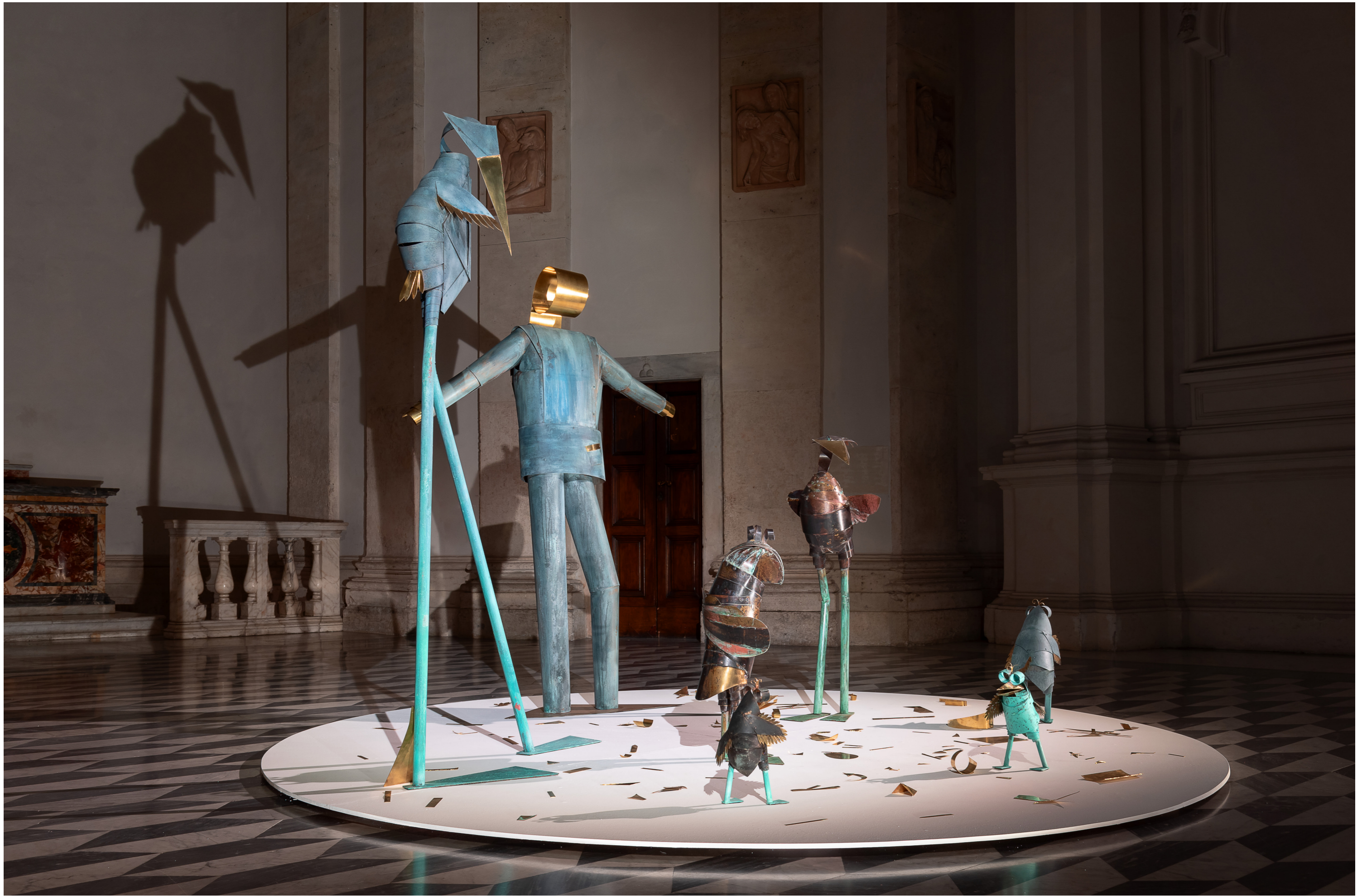
Exhibition view at Sala Santa Rita, Rome | December 20, 2024 - January 6, 2025