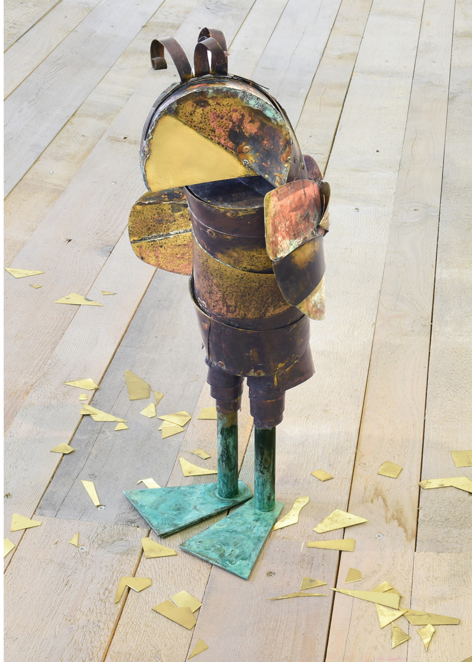
CAME/S 9256, Caroline Mesquita Penguin, 2022 patinated brass and copper / ottone patinato e rame 78 × 36 × 28 cm (30 ¾ × 14 ⅛ × 11 inches) 8000.00 € (22% VAT excluded)