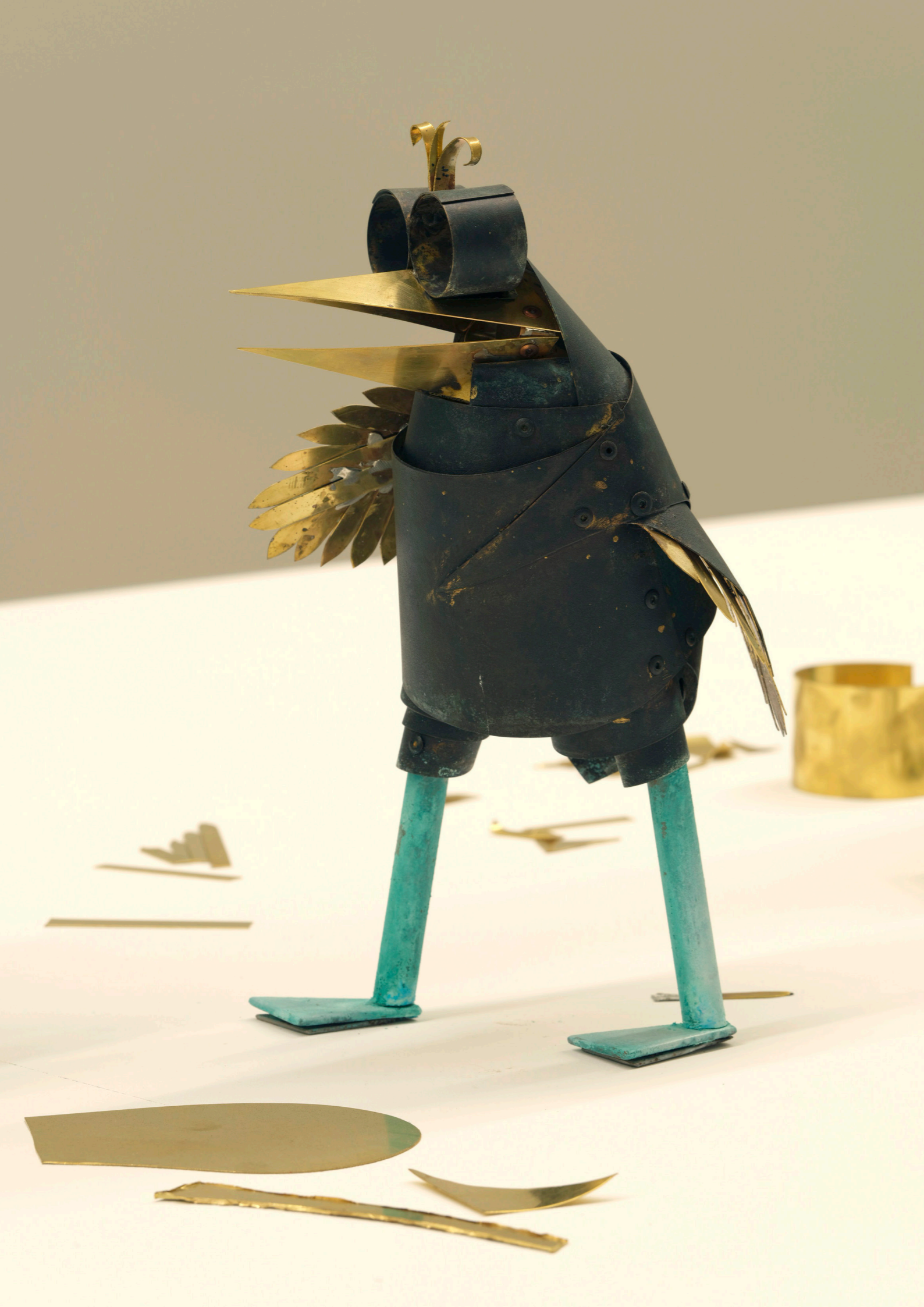
CAME/S 9445, Caroline Mesquita Moineau noir (petit), 2024 patinated brass / ottone patinato 31 × 20 × 22 cm (12 ¼ × 7 ⅞ × 8 ⅝ inches) 4000.00 € (22% VAT excluded)