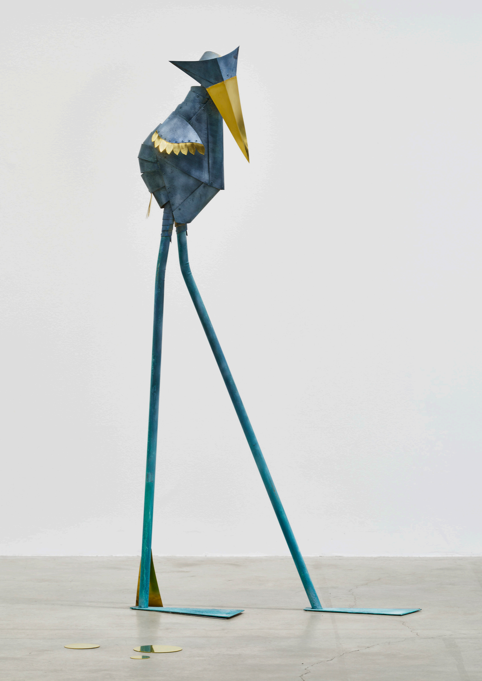
CAME/S 9254, Caroline Mesquita Echassier Bleu, 2024 patinated brass and copper / ottone patinato e rame 180 × 45 × 70 cm (70 7 / 8 × 17 3 / 4 × 27 1 / 2 inches) 15000.00 € (22% VAT excluded)