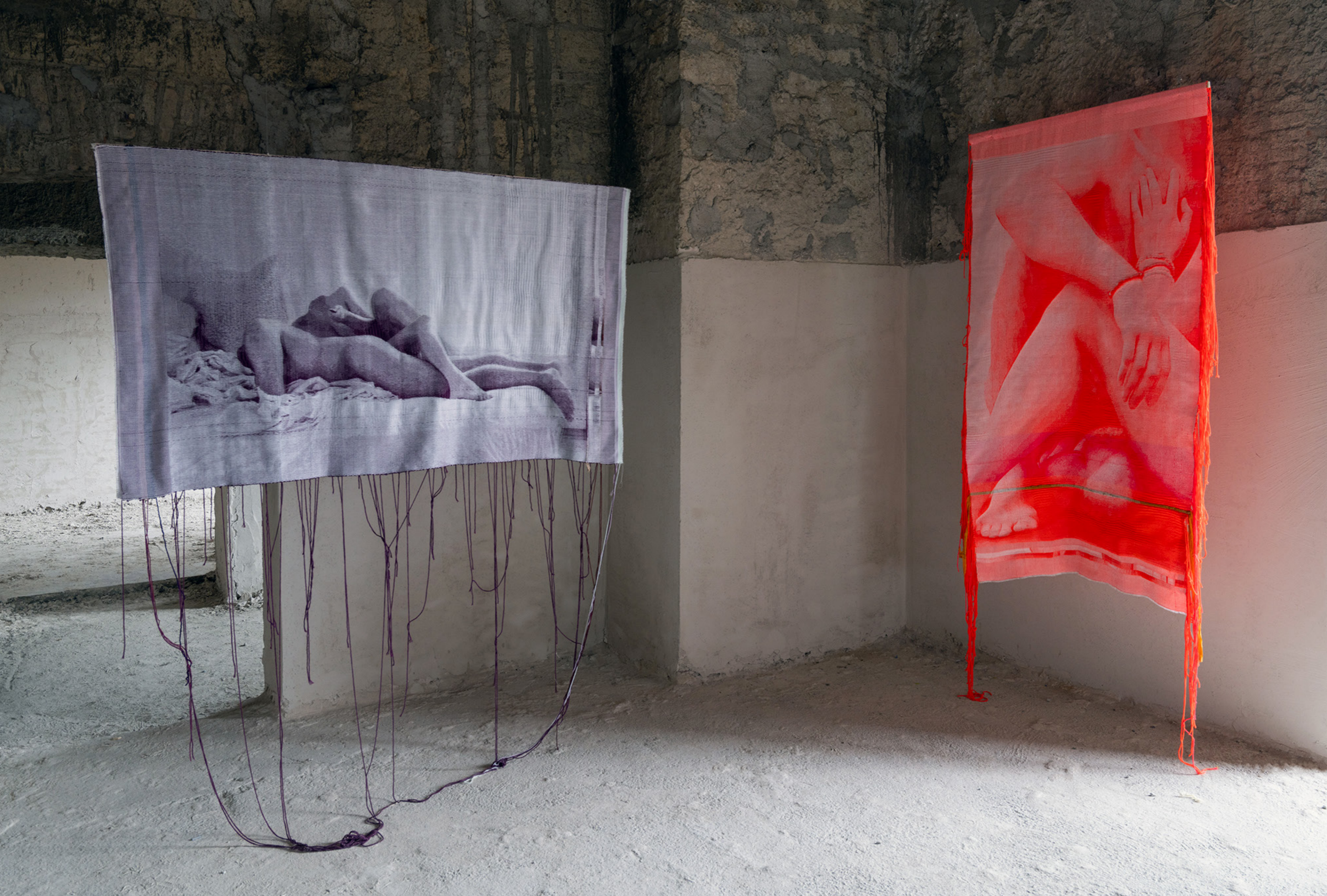
Exhibition view at Ex Ospedale Militare (Naples), October 19 - October 27, 2024; Photo by Amedeo Benestante; Courtesy of the artist, Art Days - Napoli Campania, and T293, Rome