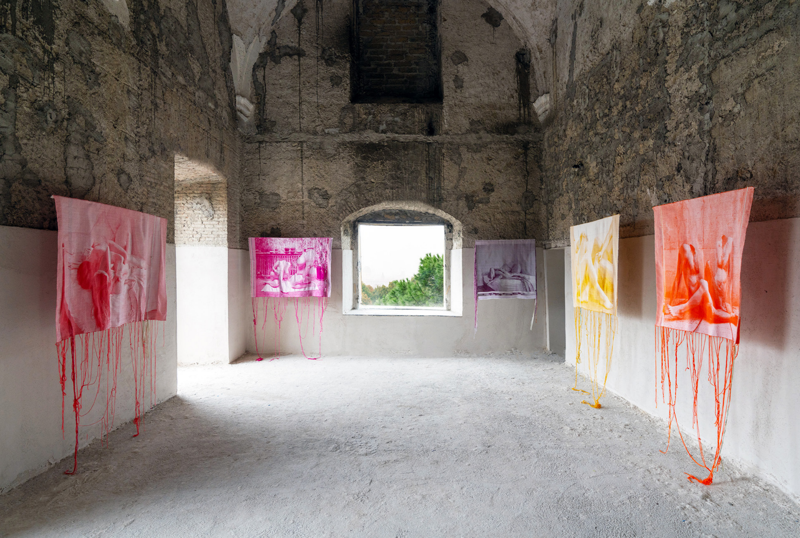
Exhibition view at Ex Ospedale Militare (Naples), October 19 - October 27, 2024