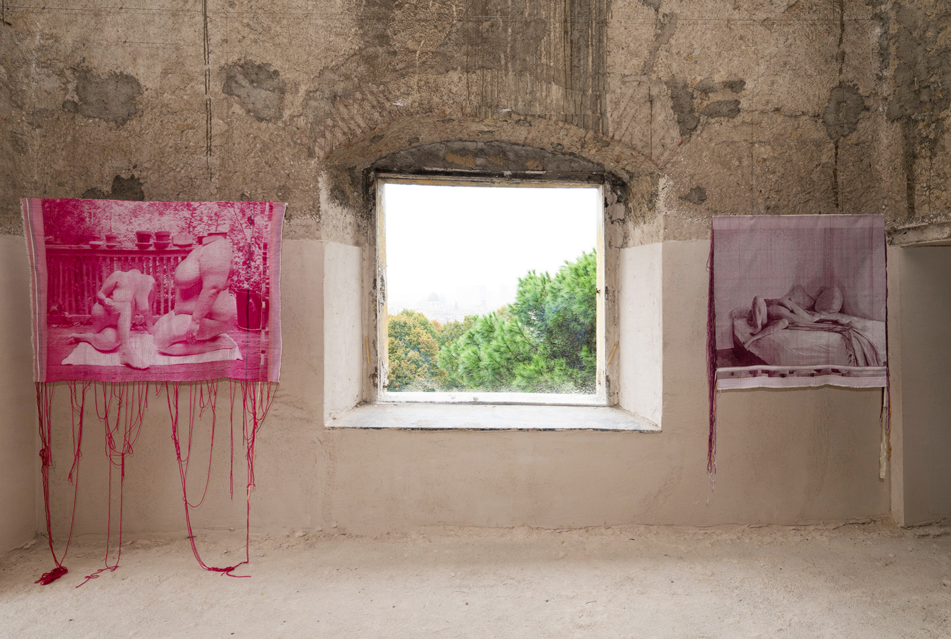
Exhibition view at Ex Ospedale Militare (Naples), October 19 - October 27, 2024