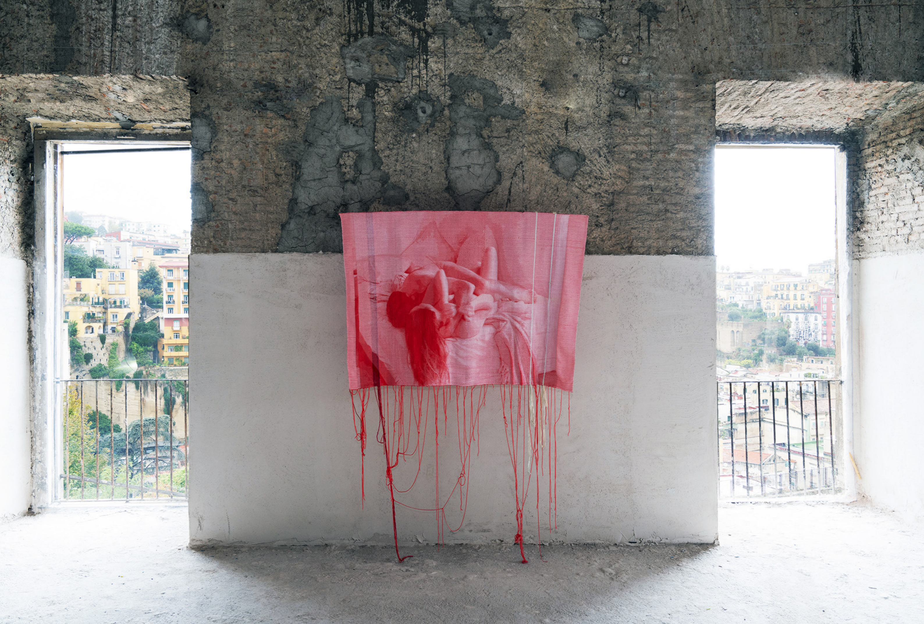
Exhibition view at Ex Ospedale Militare (Naples), October 19 - October 27, 2024; Photo by Amedeo Benestante; Courtesy of the artist, Art Days - Napoli Campania, and T293, Rome