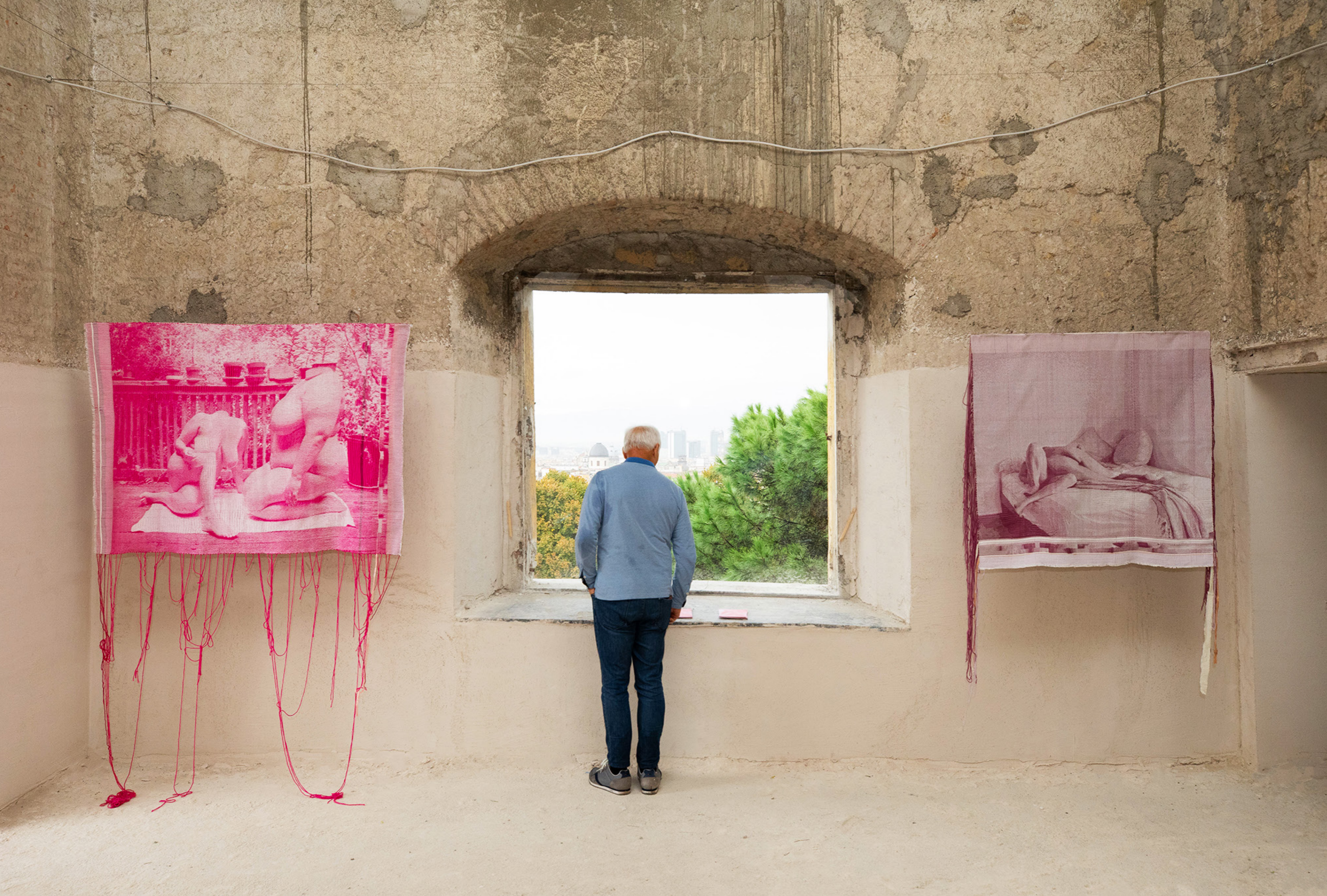
Exhibition view at Ex Ospedale Militare (Naples), October 19 - October 27, 2024