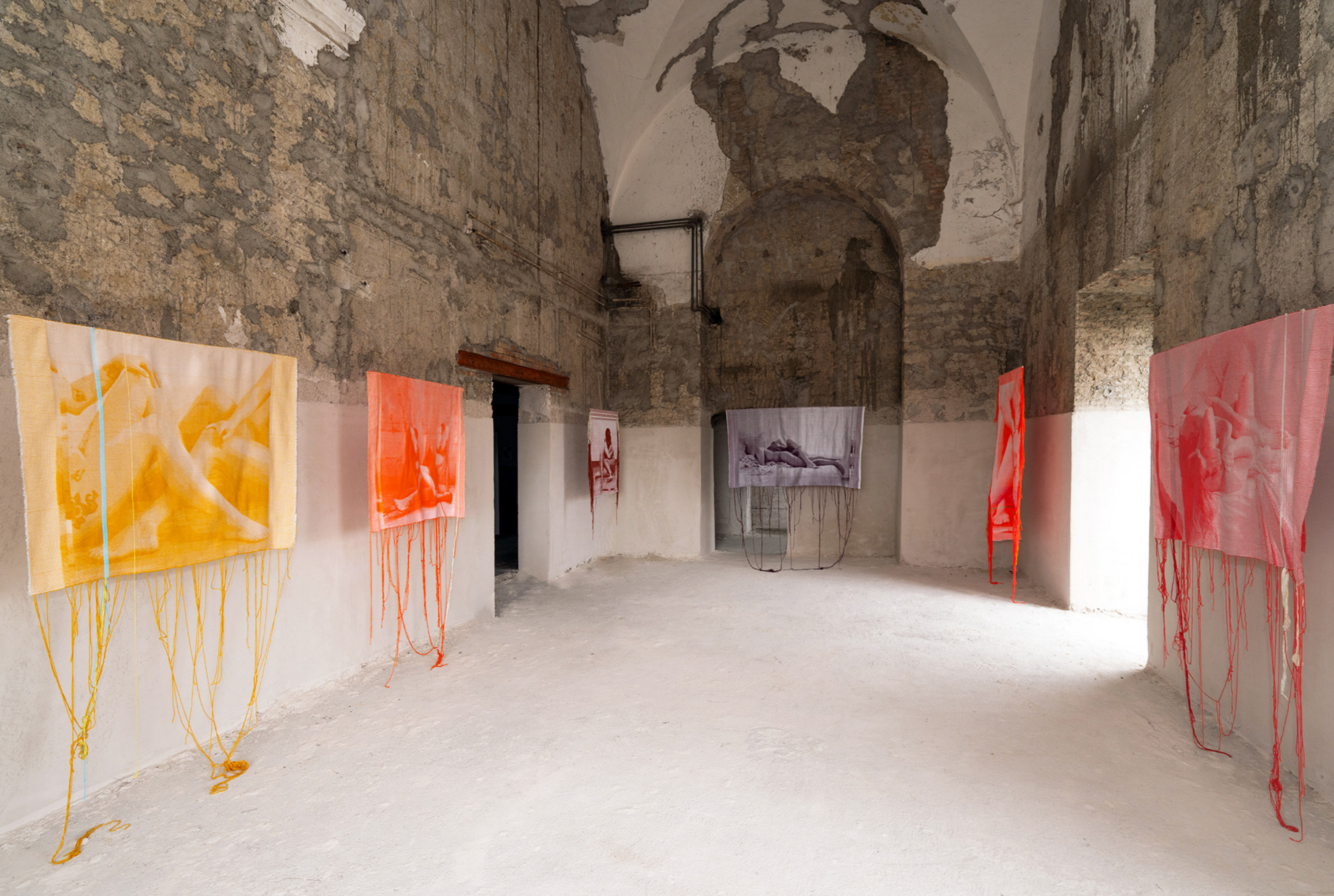
Exhibition view at Ex Ospedale Militare (Naples), October 19 - October 27, 2024; Photo by Amedeo Benestante; Courtesy of the artist, Art Days - Napoli Campania, and T293, Rome