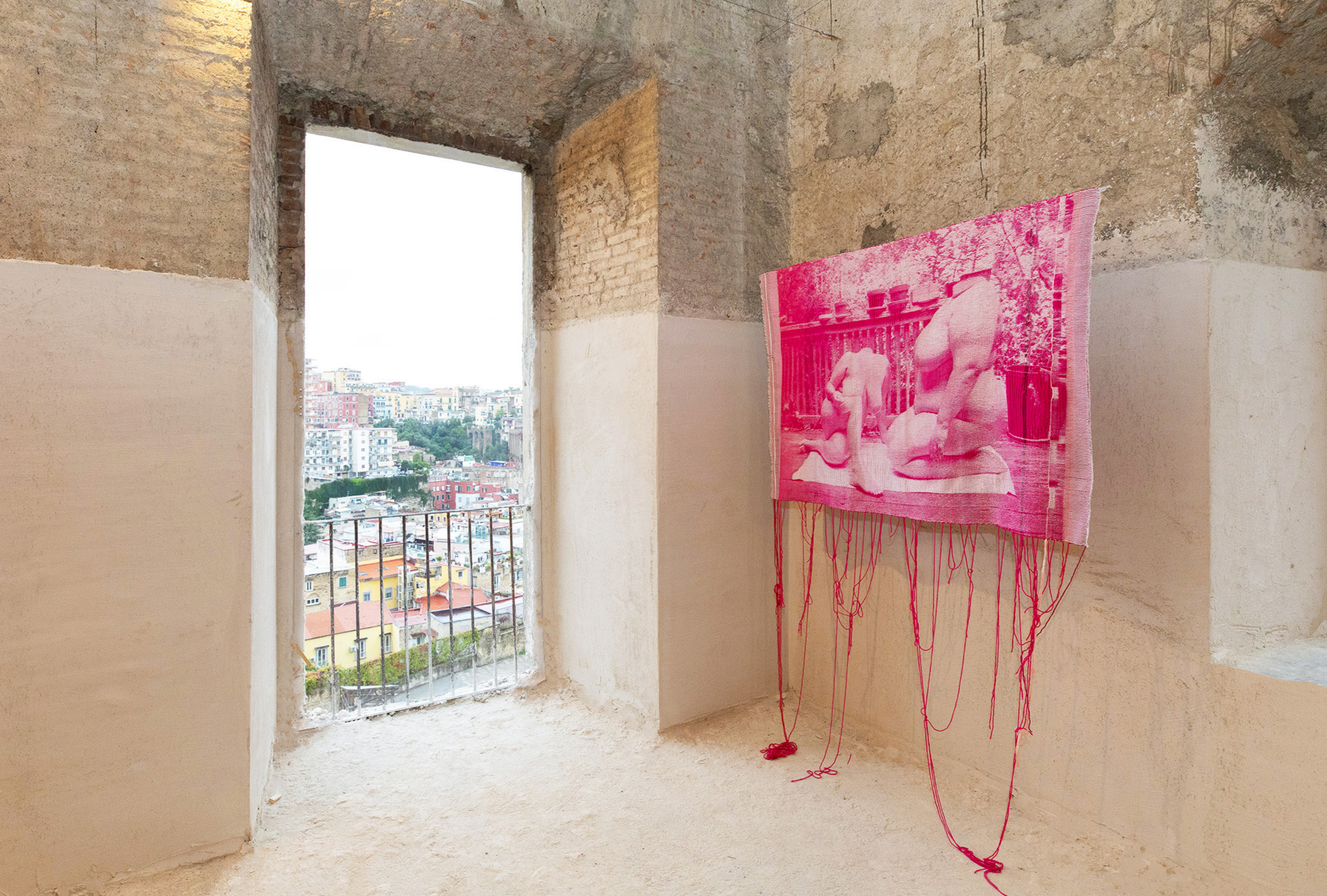
Exhibition view at Ex Ospedale Militare (Naples), October 19 - October 27, 2024; Photo by Amedeo Benestante; Courtesy of the artist, Art Days - Napoli Campania, and T293, Rome